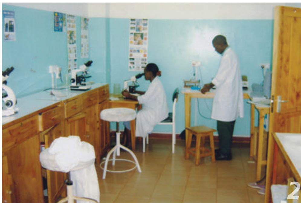
Il dispensario già attrezzato e gli operatori sanitari pronti a ricevere i numerosi malati