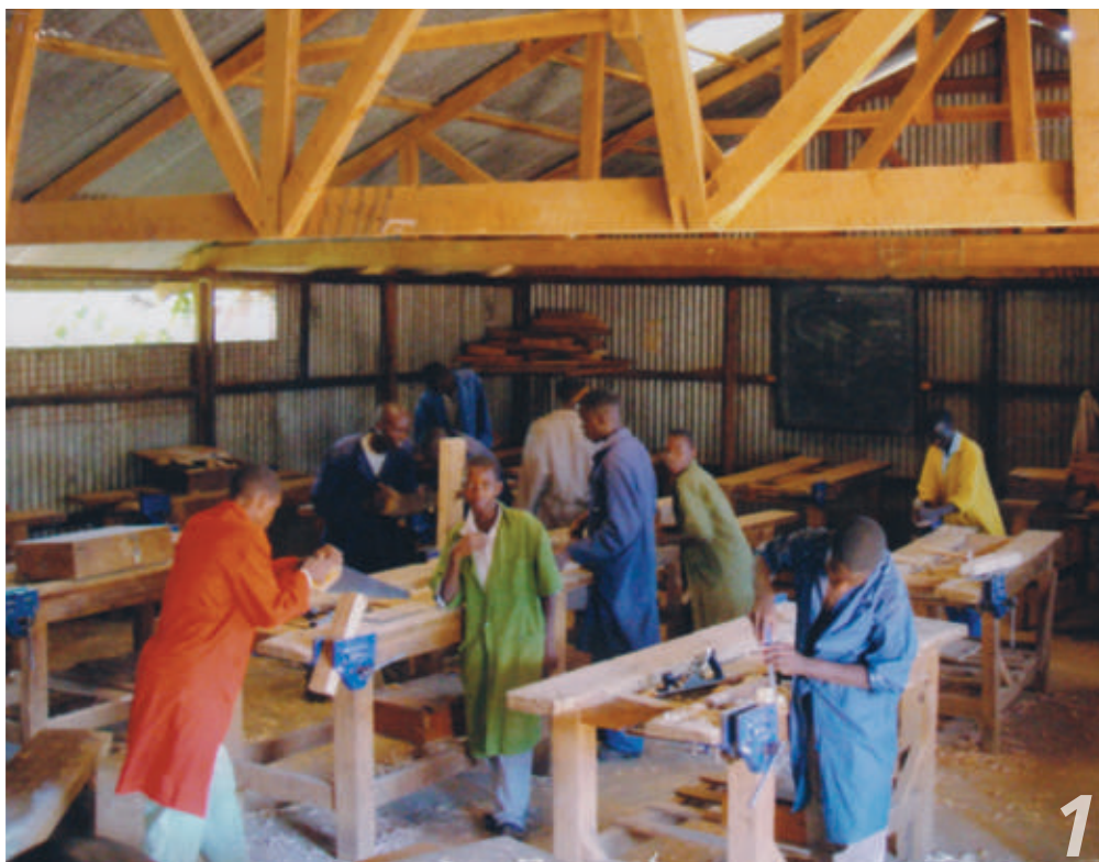
Makuyu - giovani allievi falegnami

E qui di certo il lavoro non gli manca, che invece di occuparsi di una sola missione, deve preoccuparsi di trovare aiuti e risorse per le tante case salesiane di più nazioni, cosa non facile in questi tempi di crisi. [foto 10,11,12,13,14,15]