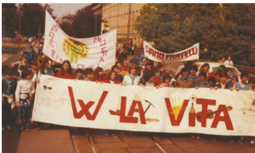
La prima marcia missionaria dei ragazzi nel 1979

Doveri verso chi si trova nel bisogno in qualunque parte del mondo, ma in modo speciale in alcuni paesi dove, ieri come oggi, fame, sopraffazioni, violenze e guerre sono all'ordine del giorno.