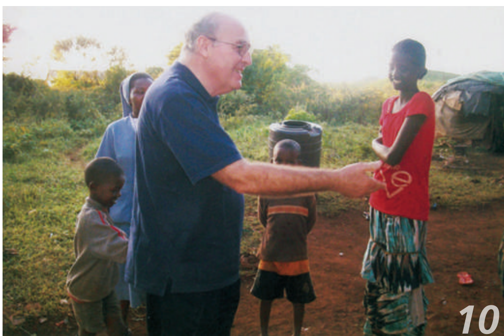
A Karare, nel nord del Kenya, in una piccola oasi circondata dal deserto, le suore di Don Bosco si prendono cura di circa 200 giovani ragazze che a disposizione per tutto hanno 1 sola bacinella d'acqua al giorno