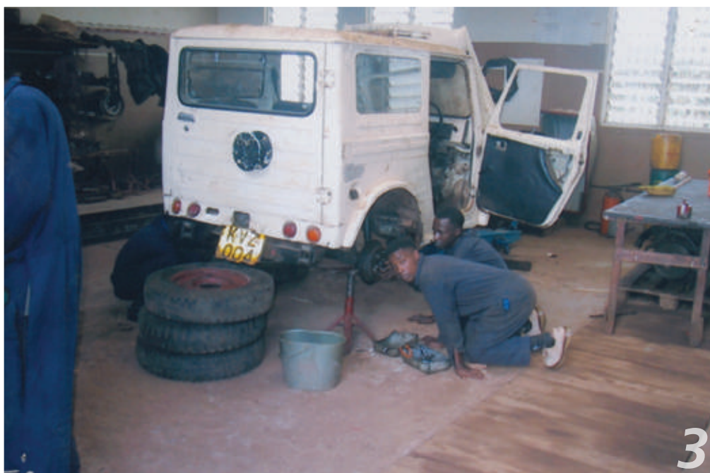
Prime esercitazioni degli allievi meccanici