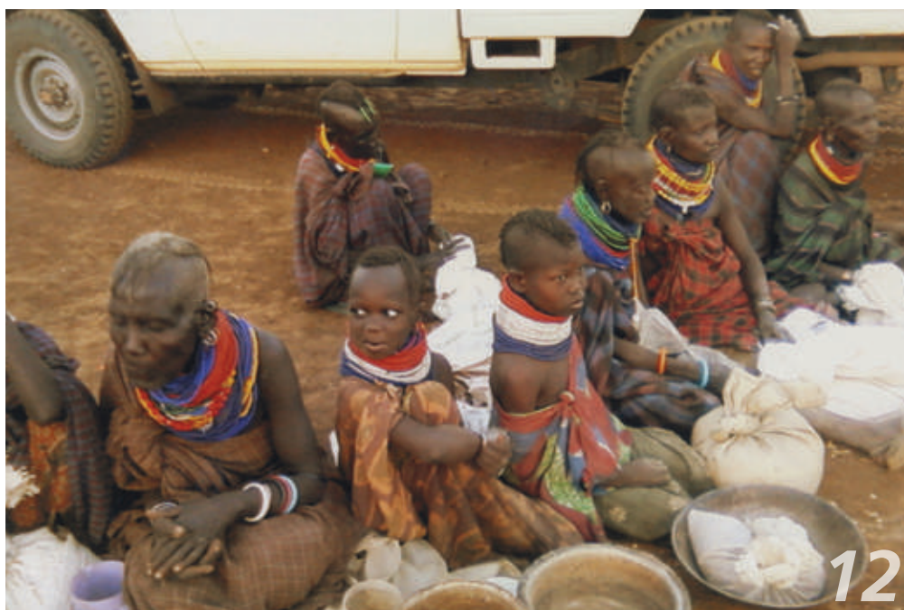
A Korr, nel deserto del Nord, la gente nomade vive di latte e carne di cammello e ... tanta fame