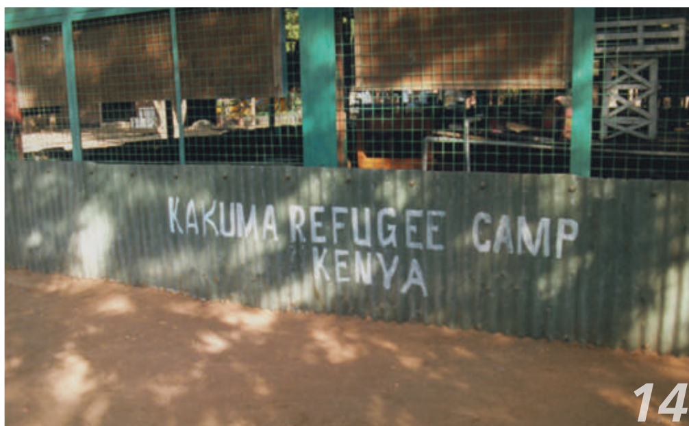
A Kakuma lo sterminato campo profughi dove arrivano quelli che fuggono dal Sudan e da altre zone dell'Africa