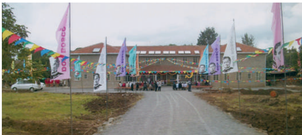
La grande casa di accoglienza per ragazzi di strada di Nairobi il giorno della sua inaugurazione

Nel 2011 ci siamo lasciati con la foto della casa per ragazzi di strada a Nairobi ormai ultimata, ma ancora carente di servizi, e per l'estate 2011 venne proposto a voi, amici e benefattori, il prog. 20/44 per acquistare pannelli solari e fornire di acqua calda questa struttura, progetto andato in porto a cui ne sono seguiti tanti altri che elenchiamo qui di seguito per ringraziarvi ancora una volta della vostra generosità grande e costante.