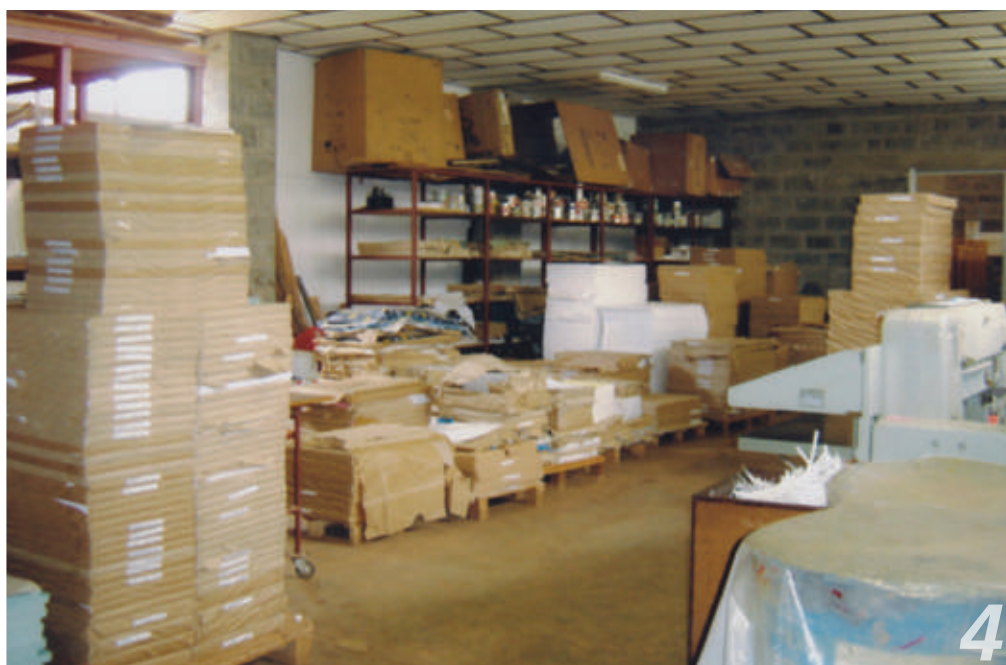
La tipografia agli inizi