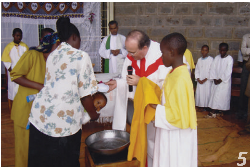
Battesimo di un piccolo parrocchiano di Makuyu