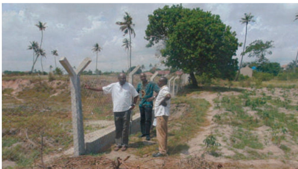
La recinzione del terreno per la costruzione della casa per i ragazzi di strada a Kinyerasi a Dar Es Salaam

Prog. 20/53 - Costruzione di una grande casa per i ragazzi di strada a Kinyeresi a Dar Es Salaam in Tanzania, proposto nell'ottobre missionario 2014 e tutt'ora in corso, a causa di mille e più lentezze burocratiche, per cui di questo progetto, per ora, possiamo mostrarvi solo la recinzione del terreno acquisito, sperando che entro l'anno riesca a partire alla grande.