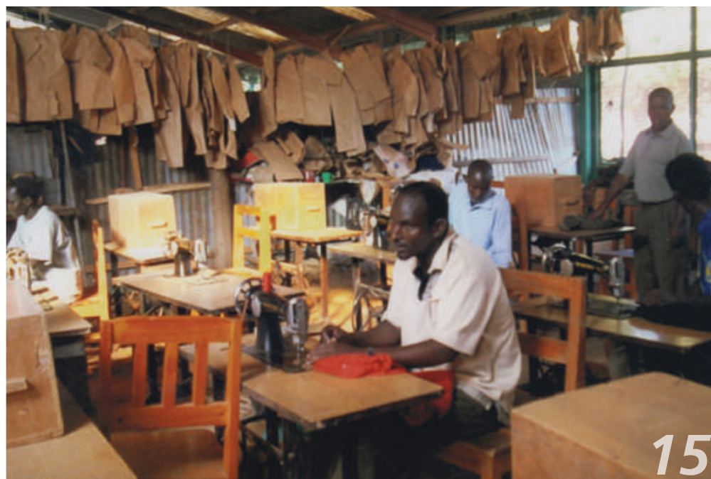
All'interno di questo campo i salesiani cercano di insegnare un mestiere per dar loro un futuro